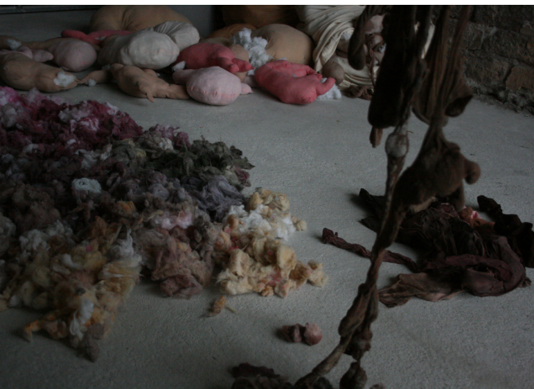
© Elizabeth St Jalmes. Performance, Centre d'art de La Bastille de Grenoble, 2010.

La deuxième partie du cycle s'effectue de plus en plus dans les réseaux de danse, de performance, de galeries. En 2013, à l'invitation des conseillers de la Région Provence-Alpes-Côte d'Azur, la compagnie passe du soutien des arts de la rue à celui de la danse. Cette collaboration se termine en 2017 après avoir créé ensemble l'exposition à danser, à toucher et à voir Mitsi, la grande invasion à La Compagnie, Lieu de création à Marseille.