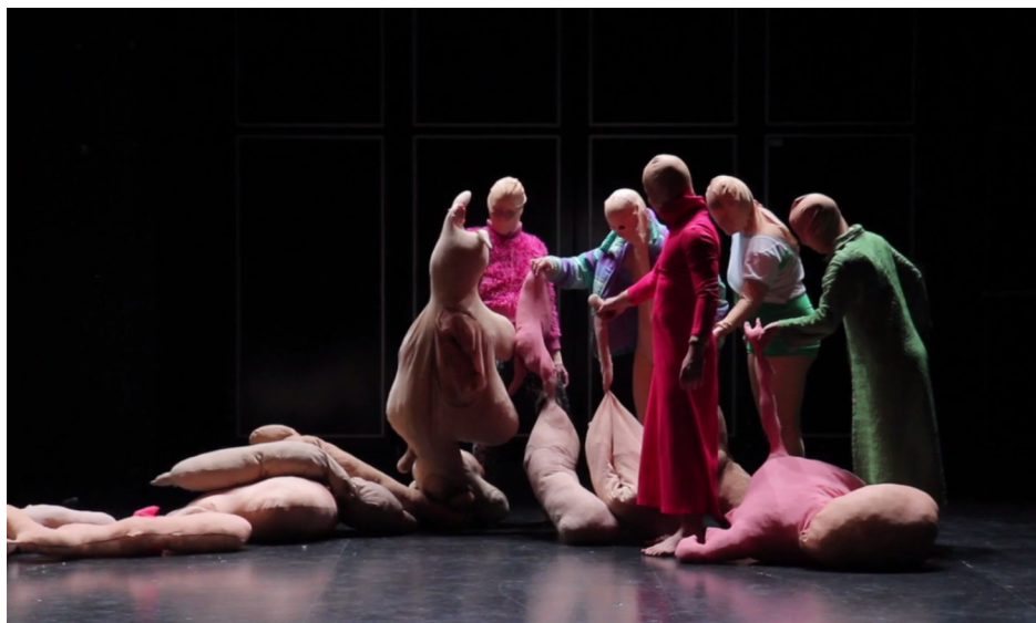
© Elizabeth St Jalmes, Next . Festival les Musiques, GMEM, Friche Belle de Mai, Marseille, 2016.