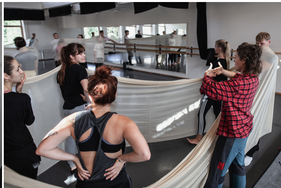
Under the skin of the city , formation pour apprenti.es-danseur.euses et amateur.ices. Performance pour 30 personnes // Klaipeda, Lituanie, 2019.