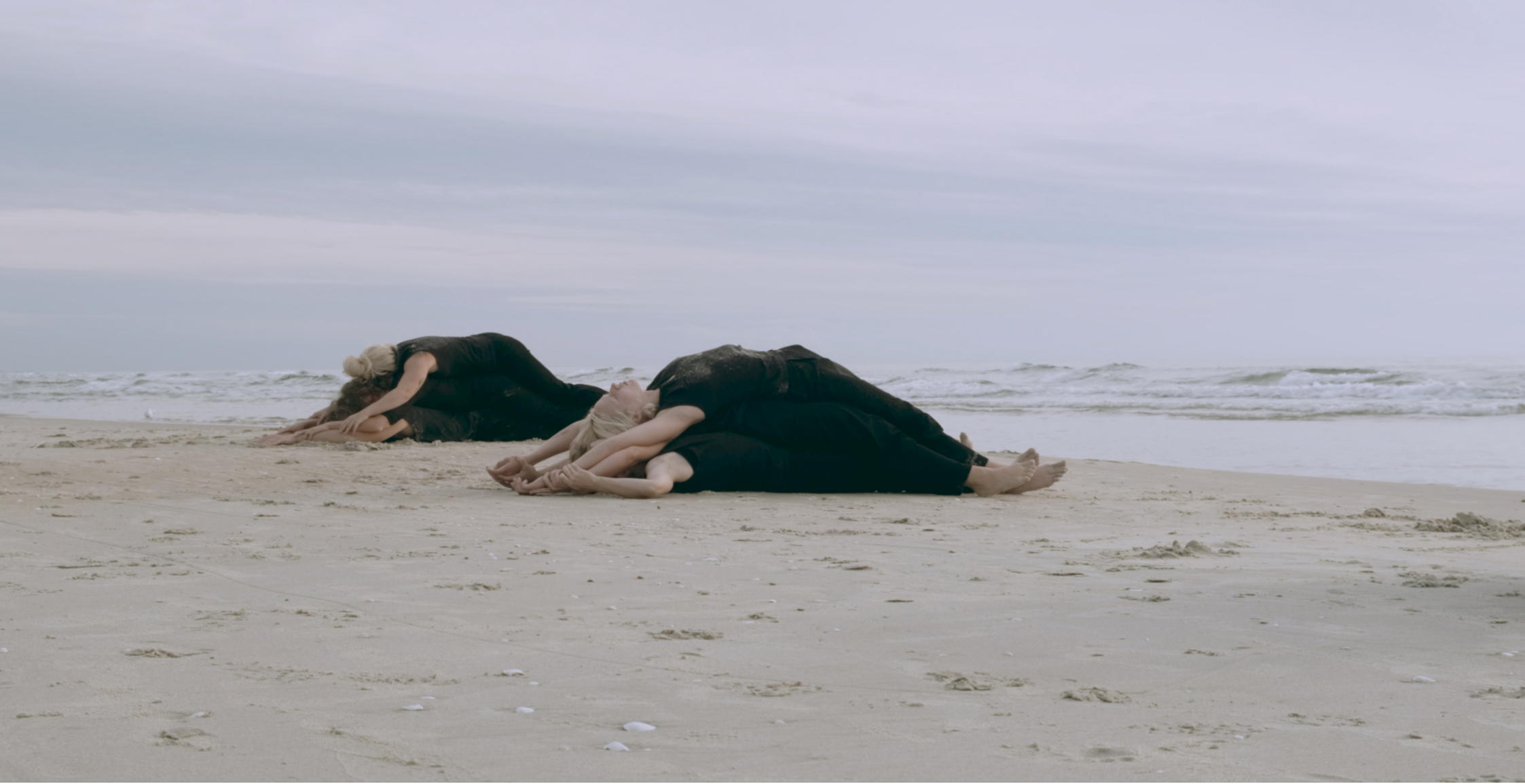
Film de danse Under the skin. 2020.