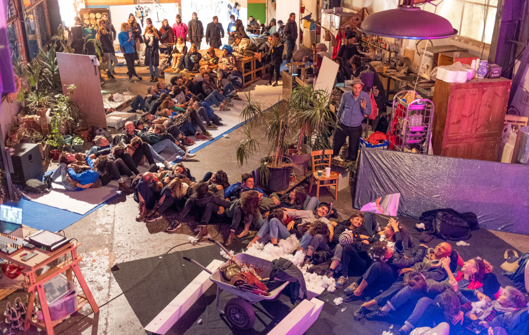
Caring Banque - Cie des Corps Parlants // Festival À corps, Aux 8 pillards, Marseille, le 19 novembre 2022.