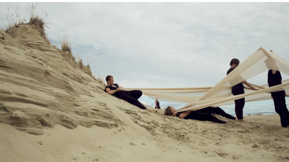
Film de danse Under the skin. 2020.

TRAILER DU FILM ICI > Informations à la demande/ merci de prendre contact avec nous.